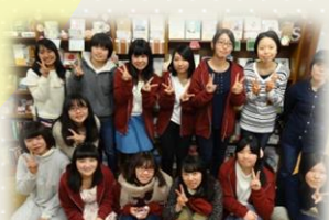
学びあい、みんなで成長☆

これから先も、一人でも多くの人々に、「本を読む楽しさ」を伝えていきたいと思えます。