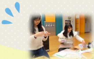
展示準備ってタイヘン...